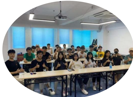
教师实践技能平培训